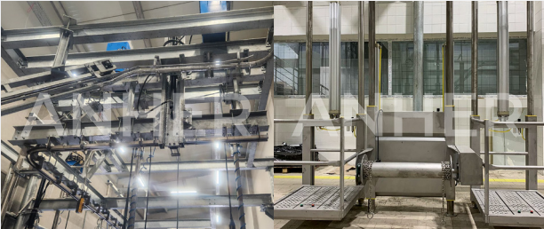
Kurban Kesim Yerleri